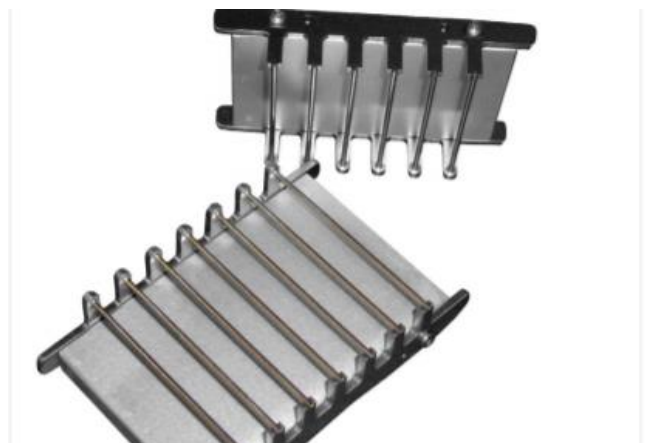
Abb.4: Pin Adhesive Test (PAT)