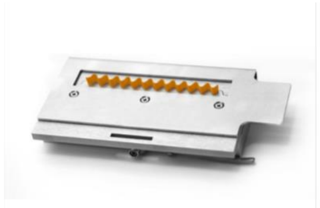
Abb.2: Concora Crush Test (CCT)